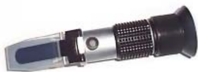
Refraktometar za imkere RHH-9ATC (praktičan uređaj za kontrolu meda)

Količina vode prije vrcanja bi trebala biti < 17 %. Uređaj ima kompenzaciju temperature.