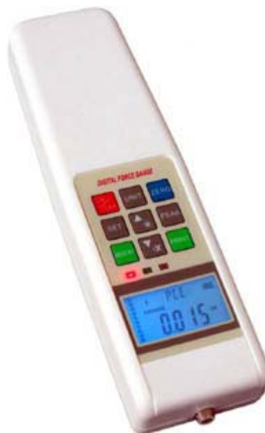
Mjerač sile SH serije sa eksternom kombi-ćelijom