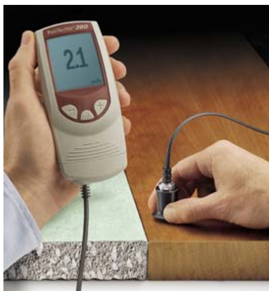
Mjerač debljine slojeva PT-200